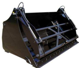
Mâchoire spéciale déchets verts

Support 2 vérins, structure haute résistance avec bagues d'usure aux articulations