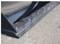
Contre lame boulonnée